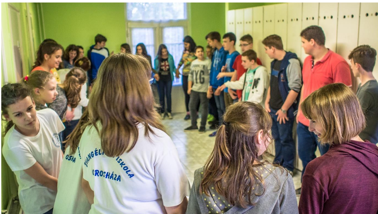
Az orosházi Székács Iskola diákjai táncház rendezésével mutatják be csapatukat az ismerkedés során