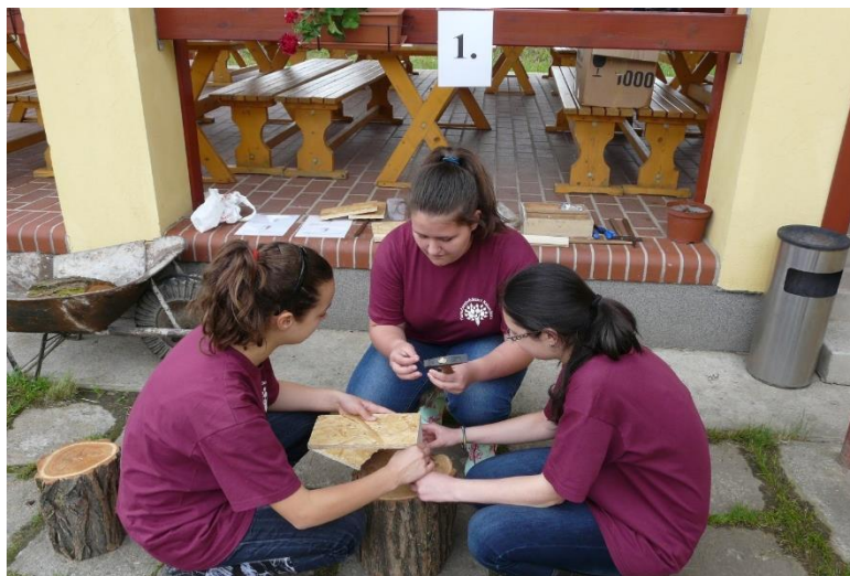
Madárodú elkészítése az akadálypálya egyik állomásán, a biharugrai Madárvártán