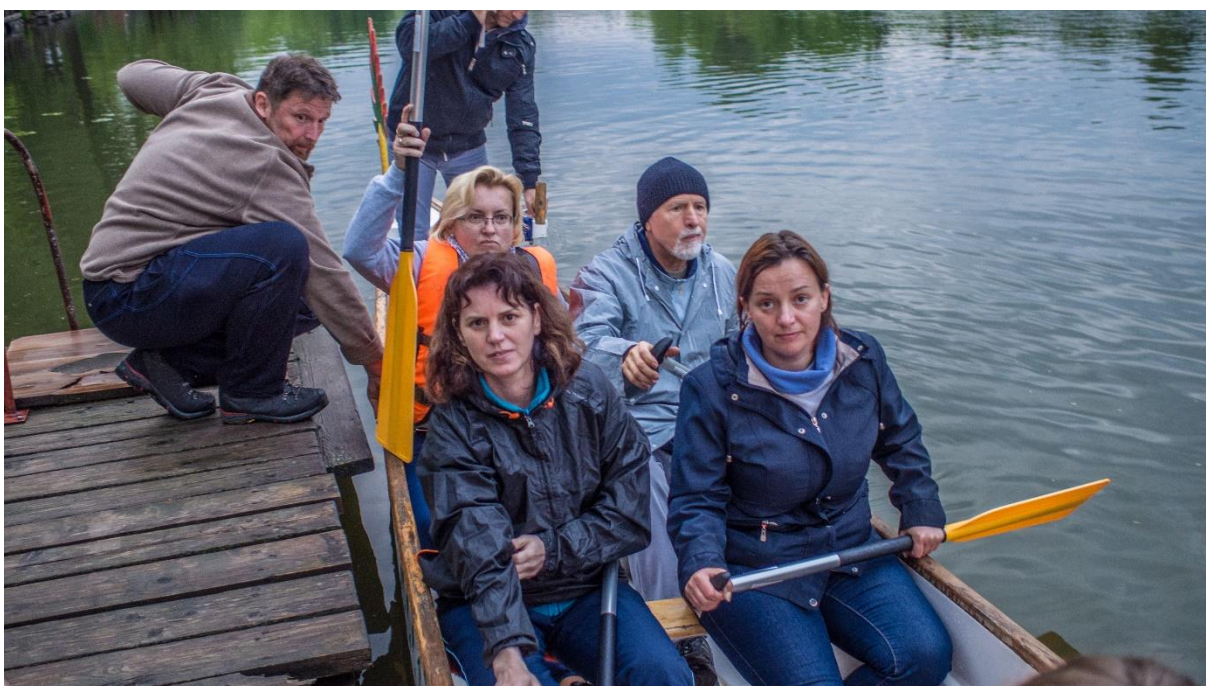
A sárkányhajóban a csapatok kísérő pedagógusai együtt eveznek a fiatalokkal (Szarvas, Körös-holtág)