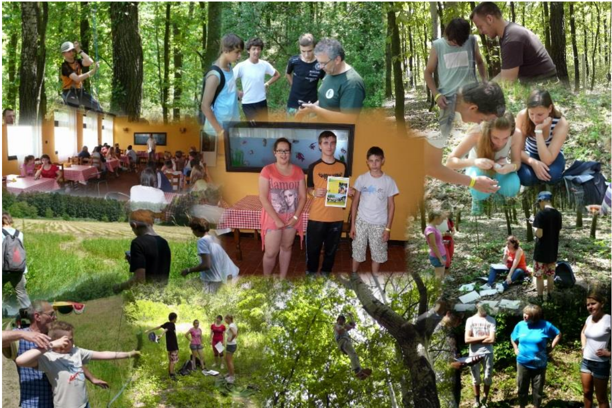
Montázs a békési kalandtúra (2014.) eseményeiből