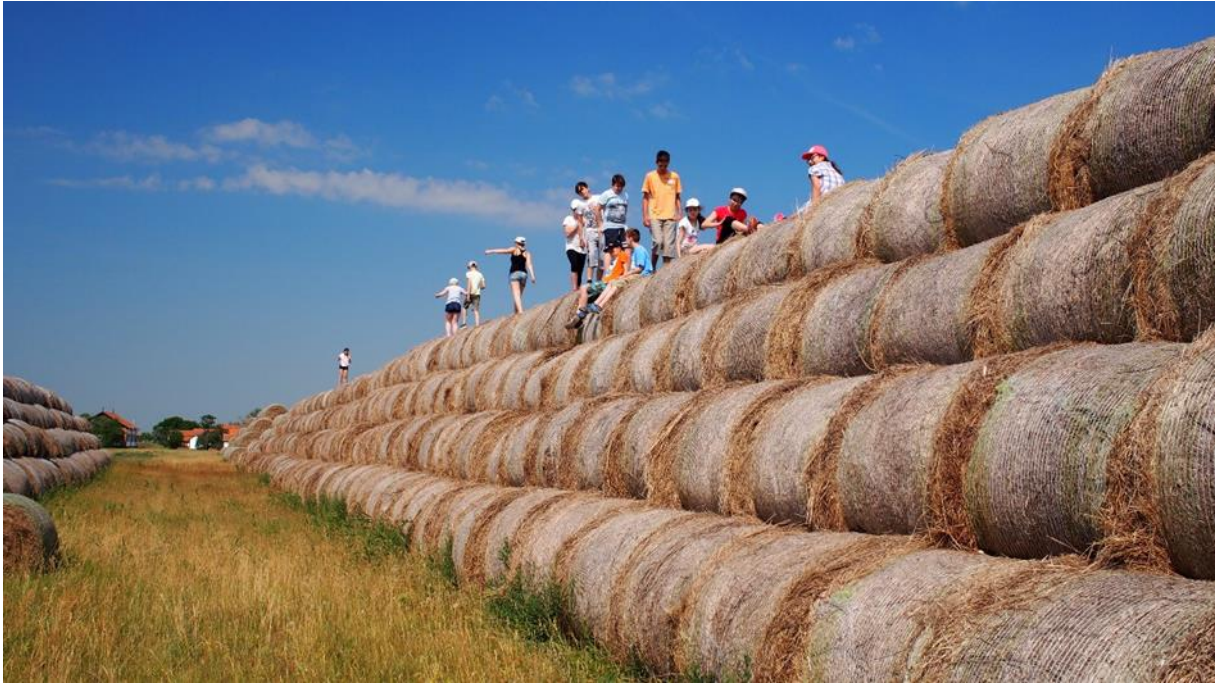
Tapasztalatgyűjtés – éppen a szénabálák tetején